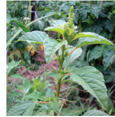
Kırmızı köklü Horoz ibiği ( Amaranthus retroflexus )