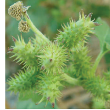
Domuz Pıtrağı ( Xanthium strumarium )