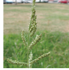
Darıcan ( Echinochloa crus galli )

KARIŞABİLİRLİLİK : COSSAONE 75 DF'yi özellikle dar yapraklı yabancıotların çok bulunduğu tarlalarda rimsulfuron terkipli ilaç ile karıştırılarak kullanılabilir. Bu konu ile ilgili olarak COSSAONE 75 DF'yi ve rimsulfuron terkipli ilaçların etiketlerinde kullanılması ile ilgili bölümleri okuyunuz. Diğer ilaçlarla herhangi bir tank karışımı yapmadan önce fiziksel, kimyasal ve biyolojik karışabilirliğin küçük çaptaki uygulamalarla gözlenmesi gerekmektedir.