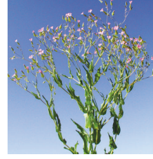
Arap baklası ( Vaccaria pyramidata )

KARIŞABİLİRLİK DURUMU : Genel olarak bütün dozlarda yayıcı yapıştırıcı kullanılabilir. Bu, PLANSTAR'ın bazı yabancı otlar üzerindeki etkisini arttırabileceği gibi etkinin daha çabuk ortaya çıkmasında neden olabilir. 2,4 D Ester ve Amin terkipli ilaçlarla karıştırılıp kullanılabilir.