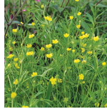
Düğün çiçeği ( Ranunculus arvensis )