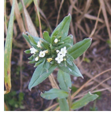
Sedef otu ( Buglossides arvensis )

ÜRÜN MÜNAVEBESİ: Buğday ve arpadaki PLANSTAR kullanımından sonra normal ekim münavebesine giren her kültür bitkisi ekilebilir.