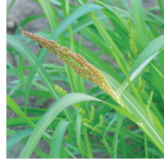
Kaynaş (Sorghum halepense)

UYGULAMA ŞEKLİ: Gerekli miktardaki ilaç az bir suyla ayrı bir kaptaki karıştırılır. Yarısına kadar su doldurulmuş ve karıştırıcısı çalışmakta olan ilaçlama tankına ilave edilerek karıştırılır ve tank suyla tamamlanır. Dekara kullanılacak su miktarını hesaplamak için önce kalibrasyon yapılır. Bunun için aletin deposuna belirli bir miktar su konur ve tarla koşullarında sabit bir hızla çalıştırılarak, mevcut su ile ne kadar alanın ıslatılabileceği hesap edilir. Buradan kalibrasyonu yapılan alet ile 1 dekara ne kadar su harcanacağı hesaplanmış olur. Daha sonra ilaçlamaya geçilir. NUANCE FORTE ilaçlamadan 1 saat sonra yağın yağmurdan etkilenmez.