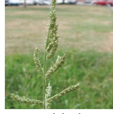
Darıcan (Echinochloa crus galli)

KARIŞABİLİRLİK DURUMU : Tavsiye olunan dozlarda Lambda-cyhalothrin, Chlorthalonil ve Pirimicarb terkipli ilaçlarla karışabilir. Büyük miktarda karışım yapmadan önce ön karışım yapılması tavsiye edilir. Bazı Kültür bitkileri için yapılan özel tavsiyeler dışında geniş yapraklı yabancıotlara etkili diğer herbisitlerle karıştırılarak kullanılmasından kaçınılmalıdır. Bu ilaçlar NUANCE FORTE tatbikatından 7 gün sonra kullanılmalıdır.