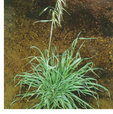
Yabani Yulaf (Avena spp.)