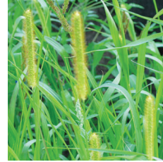
Yapışkan Darı ( Setaria sp. )

KARIŞABİLİRLİK DURUMU: Alkali ilaçlarla karıştırılmamalıdır.