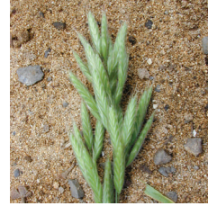
Brom ( Bromus sp. )