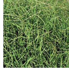
Köpek dişi ayrığı ( Cynodon dactylon )