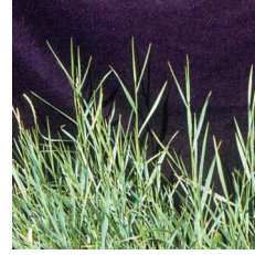
Adi Ayrık ( Agropyron repens )

DİRENÇLE İLE İLGİLİ BİLGİ : MIDFIELD 5 EC adlı bitki koruma ürünü, etki mekanizmasına göre Grup A,1 olarak sınıflandırılmış bir herbistir. Aynı etki mekanizmasına sahip bitki koruma ürünlerinin tekrarlayan uygulamaları, direnç gelişimini teşvik etmektedir. Bu nedenle, direnç gelişimini geciktirmek için MIDFIELD 5 EC in aynı üretim sezonu içerisinde önerilen toplam uygulama sayısını aşmayınız. Uygulamanın tekrarlanması gerektiği durumlarda ise, farklı etki mekanizmasına sahip (grup A,1 harici) bitki koruma ürünlerinin kullanılmasına özen gösteriniz.