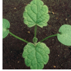
Ballıbaba ( Lamium spp. )