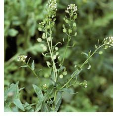
Akça çiçeği ( Thlaspi arvensis )

JETANAL COM adlı bitki koruma ürünü, etki mekanizmasına göre Grup C1, 5 olarak sınıflandırılmış bir herbisittir. Aynı etki mekanizmasına sahip bitki koruma ürünlerinin tekrarlayan uygulamaları, direnç gelişimini teşvik etmektedir. Bu nedenle, direnç gelişimini geciktirmek için JETANAL COM'un aynı üretim sezonu içerisinde önerilen toplam uygulama sayısını aşmayınız. Uygulamanın tekrarlanması gerektiği durumlarda ise, farklı etki mekanizmasına sahip (grup C1,5 harici) bitki koruma ürünlerinin kullanılmasına özen gösteriniz.