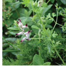
Şahtere ( Fumaria sp. )