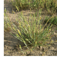
Tilki kuyruğu ( Alopecurus myosuroides )

MUNAVEBE BİTKİLERİ : FENDAL 33 EC ile ilaçlamadan 6 ay sonrasına kadar aşağıda belirtilen bitkilerden başkası rotasyona giremez.