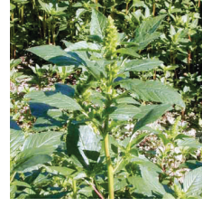
Çoban değneği ( Polygonum spp )

FENDAL 33 EC bu bitkilerde tohum ekim sonrası bitki çıkış öncesi (pre-emergence) olarak toprak yüzeyine uygulanır. Tohum ekim derinliği 4-5 cm olmalıdır. Patates'te, patates ve yabancı otların çıkışlarından önceki dönemde uygulanmalıdır. Mısırdaki FENDAL 33 EC kesinlikle toprağa karıştırılmaz ve kesinlikle şeker mısırında kullanılmaz.Tohum üretimi için ekilen mısır sahalarında kullanılmadan önce yetkili kişilere danışınız. Soğanda çıkış öncesi (pre-emergence) kullanılabilmesi gibi soğanın iki yapraklı döneminden sonrada kullanılabilir. Ancak otlar 1-2 yapraklı devresini geçmeden uygulanmalıdır. Domates fideleri ilaçlamadan sonra takiben 2. ve 6. günler arasında dikilmelidir. Fide dikimi sırasında ilaçla bulaşık toprak tabakasının köklere temas etmemesine dikkat edilmelidir. Kurak şartlarda FENDAL 33 EC uygulamasını takip eden 3-7 gün içinde 5-10 mm sulama yapılmalıdır.