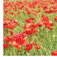
Gelincik ( Papaver rhoeas )