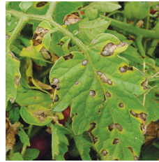
Erken yaprak yanıklığı ( Alternaria cucumerina )