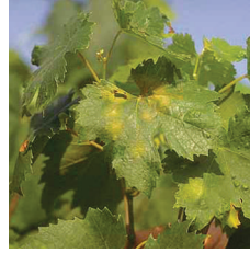
Mildiyö ( Plasmopara viticola )