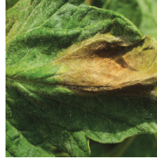
Mildiyö ( Phytophthora infestans )