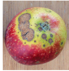
Karaleke ( Venturia inaequalis )

KARIŞABİLİRLİLİK DURUMU : Diğer ilaçlarla karıştırılarak kullanılabilir. Gerekli görülmesinde bir ön karışım denemesi yapılması önerilir.