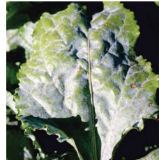
Külleme ( Erysiphe polygoni )