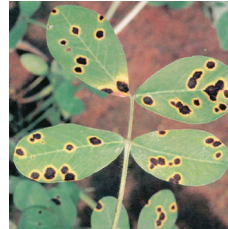
Yaprak lekesi ( Cercospora beticola )