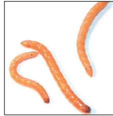
Tel kurtlar ( Agriotes spp. )