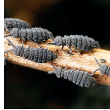
Yay kuyruklular ( Collembola )