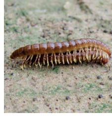
Kırkayaklar ( Diplopoda )

Thiram ve Hymexazol terkipli ilaçlarla karıştırılabilir.