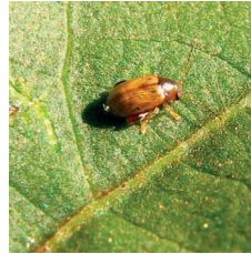
Toprak pire böcekleri ( Chaetocnema spp. )