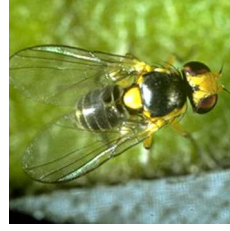
Yaprak galeri sineği ( Liriomyza spp )

Not: Bitki aksamını ilaçlı mahlul damlalarının birleşerek bitkiden yıkanarak uzaklaşmasına özen gösteriniz. İlaçlı mahlulün ilaçlanacak bitkilerin dışına gelmemesine dikkat ediniz. İlaçlanan yerin üzerinden bir daha geçerek veya tavsiye edilenden daha yüksek doz kullanmak suretiyle aşırı dozdan kaçınınız.