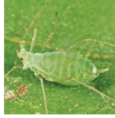
Patates yaprak biti ( Macrosiphum euphorbiae )

DİRENÇLE İLE İLGİLİ BİLGİ : SEEMACTIN adlı bitki koruma ürünü, etki mekanizmasına göre Grup 18B olarak sınıflandırılmış bir insektisittir. Aynı etki mekanizmasına sahip bitki koruma ürünlerinin tekrarlayan uygulamaları, direnç gelişimini teşvik etmektedir. Bu nedenle, direnç gelişimini geciktirmek için SEEMACTIN'in aynı üretim sezonu içerisinde önerilen toplam uygulama sayısını aşmayınız. Uygulamanın tekrarlanması gerektiği durumlarda ise, farklı etki mekanizmasına sahip (Grup 18B harici) bitki koruma ürünlerinin kullanılmasına özen gösteriniz.