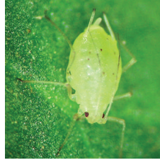
Domates Şeftali Yaprak biti ( Myzus persicae )

KARIŞILIRLIK : Bordo bulamacı hariç diğer insektisit ve fungusitlerle karışabilir.