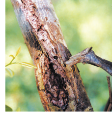
Kahverengi çürüklük Gövdede zamklanma hastalığı ( Phytophthora citrophthora )

DİRENÇLE İLE İLGİLİ BİLGİ : PLACATE 80 WP adlı bitki koruma ürünü, etki mekanizmasına göre Grup 33 olarak sınıflandırılmış bir fungusittir. Aynı etki mekanizmasına sahip bitki koruma ürünlerinin tekrarlayan uygulamaları, direnç gelişimini teşvik etmektedir. Bu nedenle, direnç gelişimini geçiktirmek için PLACATE 80 WP'in aynı üretim sezonu içerisinde önerilen toplam uygulama sayısını aşmıyınız. Uygulamanın tekrarlanması gerektiği durumlarda ise, farklı etki mekanizmasına sahip (grup 33 harici) bitki koruma ürünlerinin kullanılmasına özen gösteriniz.