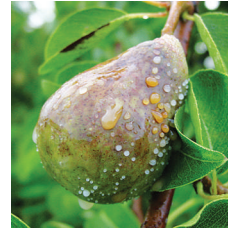
Ateş yanıklığı ( Erwinia amylovora )