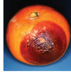
Meyvede hasat sonrası kahverengi çürüklük ( Phytophthora citrophthora )