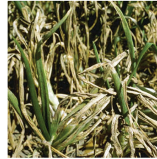
Soğan mildiyösü ( Perenospora destructor )