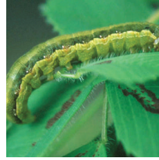
Çizgili Yaprak kurdu ( Spodoptera exiqua )

AMBALAJI AÇMADAN ÖNCE İLK YARDIM TEDBİRLERİ VE EMNİYET TEDBİRLERİNİ OKUYUNUZ.