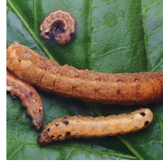
Yaprak kurdu ( Spodoptera littoralis )

PINTRO 050 EC, nötr reaksiyonlu insektisitler ile karıştırılabilir. Karıştırılacak ilacın tereddüt halinde çiftçiye ön karışım yapması tavsiye edilir.