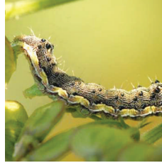
Yeşilkurt ( Helicoverpa armigera )