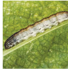
Bozkurt ( Agrotis spp. )

Bunun için ilaçlama aletinin tankı ilaçsız suyla doldurulur. İlaçlama yapar gibi belli bir hızla gidilerek belli bir alan ıslatılır. Daha sonra ıslatılan alan ve harcanan su ölçülerek, bir dekara atılması gerekli ilaç su miktarı orantı yoluyla hesaplanır. Hesaplanan ilaç miktarı ve gerekli su aletin karıştırıcısı çalıştırılarak deposuna dolsurur. Daha sonra aynı hız ve vitesle ilaçlamaya geçilir.