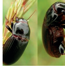
Ekin Kambur Böceği ( Zabrus spp. )