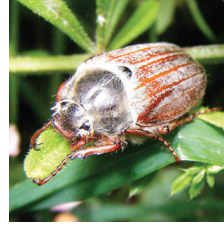
Mayıs böceği ( Melolontha melolontha )

Toprak ilaçlaması için : Toprak hazırlığı sırasında dekara tavsiye edilen dozda ilaç ölçülüp, bir miktar ince kum-toprak ile iyice karıştırılıp toprak sathına düzgünce serpilir. Daha sonra 10-15 cm toprak işleme ile toprağa karıştırılır. Dekara doz uygulamalarında tavsiye edilen dozun dekara doğru ve homojen bir şekilde atılabilmesi için kalibrasyon yapılması gerekmektedir.