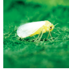
Beyaz sinek ( Bemisia tabaci )