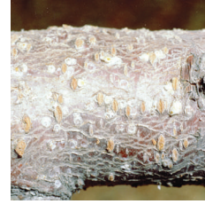
Şeftali dut kabuklu biti ( Pseudaulacapis pentagone )