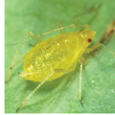
Yaprak Biti ( Myzus persicae )