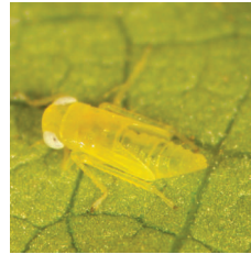
Yaprak Piresi ( Empoasca spp. )