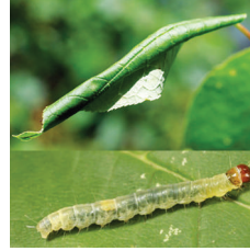
Yaprak Büken ( Archips rosana )