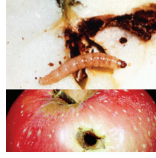
İçkurdu ( Cydia pomonella )

Alkali ilaçlar hariç bilinen birçok ilaçla karışabilir. Ancak çiftçiye kendi imkan ve sorumluluğunda bir ön karışım denemesi önerilir.