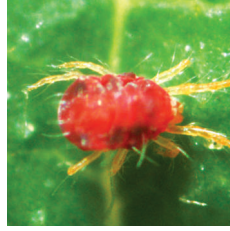
Kırmızı Örümcek ( Tetranychus spp. )